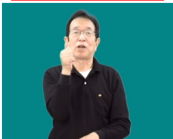
読み取り口述 「手話通訳者」